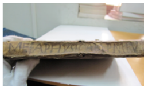
Detalle: Tapa frontal y lomo